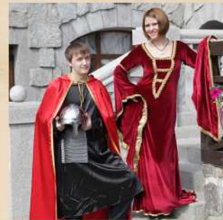
Rent of costumes or armors for photo sessions Cost 500 P