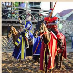
Horse knightly shows Cost 350 P