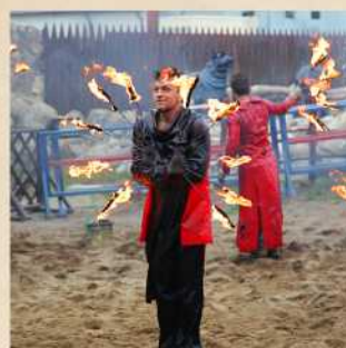
Конно-огненное шоу Стоимость 350 Р с гостя