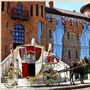
Rent of carriage for photo sessions Cost 6000 P