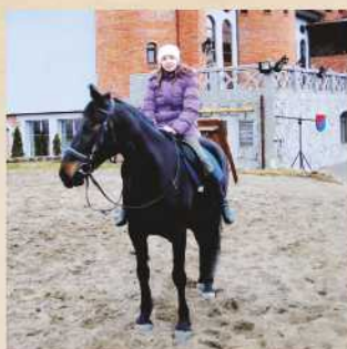
Катание на лошадях Стоимость 300 Р