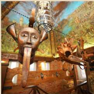
The Museum of medieval torture and punishment Cost 250 P