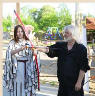
Стрельба из лука Стоимость 300 Р Сезонно - уточните у вашего официанта.

Детская комната. Предоставляется бесплатно для клиентов ресторана и отеля