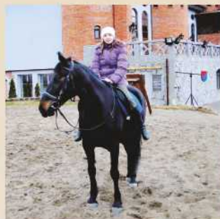
Horseback riding Cost 300 P