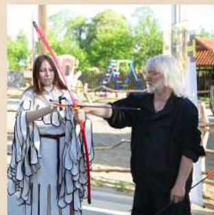
Archery Cost 300 P Seasonally. Ask your waiter

Children's playroom. Free for clients of the restaurant and hotel