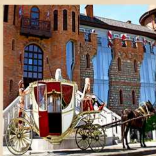
Прокат кареты для фотосессии Стоимость 6000 Р