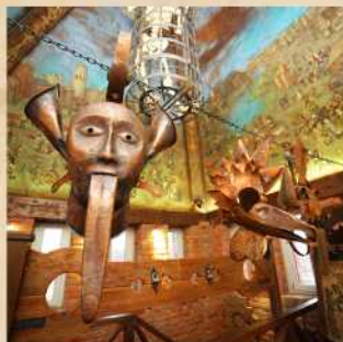
Музей средневековых пыток и наказаний Стоимость 250 Р