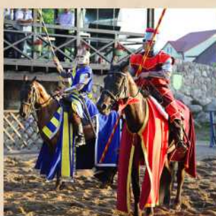
Конно-рыцарское шоу Стоимость 350 Р с гостя