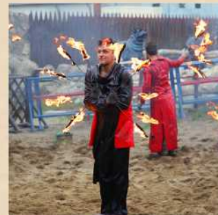
Horse fire show Cost 350 P