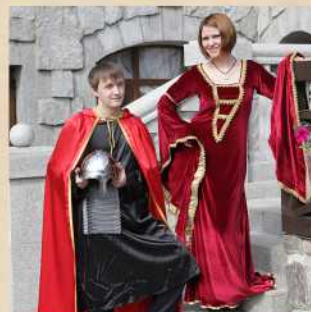
Прокат костюма или доспехов для фотосессии Стоимость 500 Р